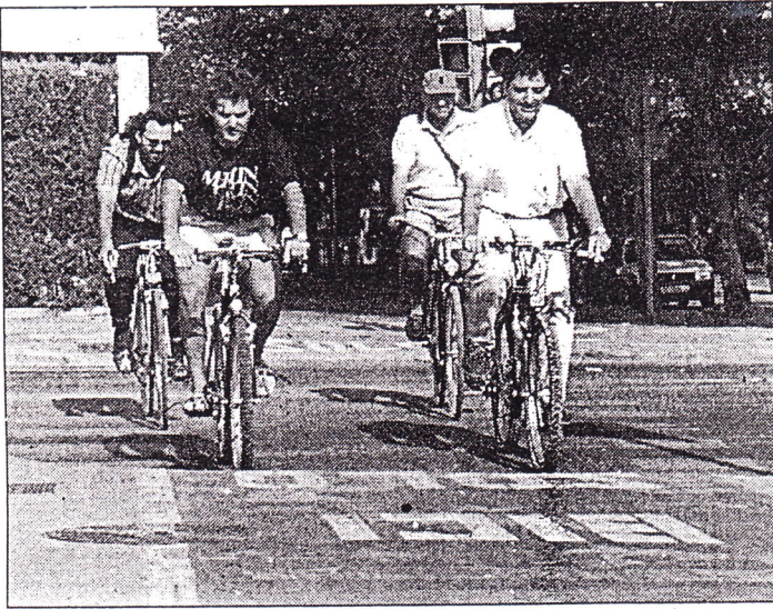
Francisco Camps acompañado por miembros de Valencia en Bici en una inspección del carril-bici. verano 1992.